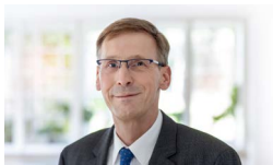
Thomas Class Ludwigsburg

Auch im Namen unserer Teams wünschen wir Ihnen viel Freude bei der Lektüre und natürlich bei der Teilnahme an unseren Veranstaltungen.